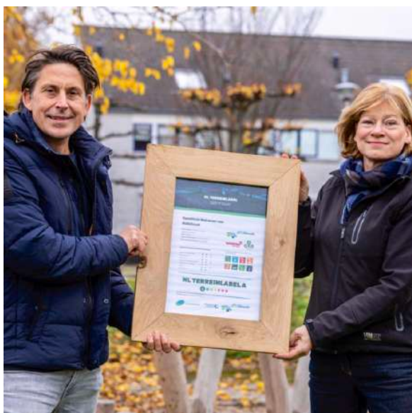
Uitreiking van het NL Terreinlabel-certificaat

“Beheert u meerdere terreinen of vastgoedobjecten en weet u niet waar u moet beginnen met verduurzamen? Een erkende NL Terreinlabel Expert is in staat om uw hele portefeuille door te meten en met u te bespreken waar welke maatregelen het meeste opleveren.”